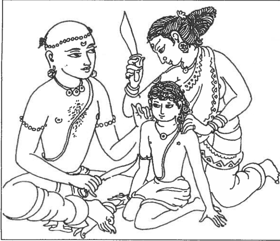
‘நம்மைக் காக்க வரும் மணி’

நல்ல குடும்பங்களில் கணவன் தான் செய்யும் நல்லறங்களுக்கு இசைந்தவளாக மனைவியையும் பயிற்ற வேண்டும் என்பதை இப்பகுதி எடுத்துக்காட்டுகிறது.