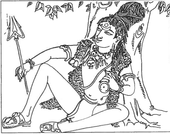
கபாலி வடிவில் சிவபெருமான்

பணியாளர்கள் என்று பலரும் எவ்வாறு வாழ்தல் வேண்டும் என்பதையும் சமூக நாட்டத்தோடு எடுத்துரைக்கிறார். கணவன், இல்லறத்தில் அரசன் என்றால், மனைவி அமைச்சருக்கு நிகரானவள் என்பது சேக்கிழாரின் கணிப்பு. இளையான்குடி மாற நாயனாருக்கு, நள்ளிரவில் வந்த அதிதிக்கு உணவு படைப்பதற்கு உரிய வழிமுறைகளை எடுத்துரைத்த அவர் துணைவியாரின் கூர்த்த அறிவுடைமை முன்னரே எடுத்துக் காட்டப்பட்டது. அப்பூதி அடிகள் வரலாற்றில் திருநாவுக்கரசர், அப்பூதி அடிகள் வேண்டிக் கொண்டவாறு, அவர் இல்லத்தில் நண்பகல் உணவருந்த இசைகிறார். இந்த மகிழ்ச்சியை அப்பூதி அடிகளார் முதற்கண் மனைவியோடு பகிர்ந்துகொண்டமையைச் சேக்கிழார் குறிக்கிறார்.